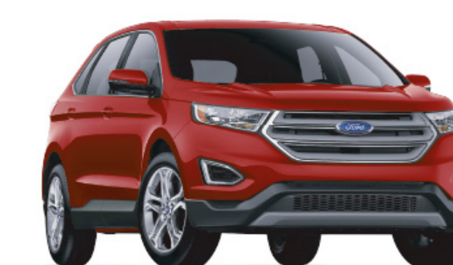
Burgundy Velvet Metallic Tinted Clearcoat

Especificaciones sujetas a cambio sin previo aviso. Las imágenes son de referencia y algunas especificaciones pueden variar frente a las versiones comercializadas en Ecuador, para más información ingresa a ford.com.ec Ford Motor informa a todos los usuarios de esta página, que la información contenida en ella y en sus distintos sitios es de carácter informativo y referencial. En caso de requerir información precisa respecto de alguno de los productos o servicios a que se refiere esta página, será necesario que el usuario contacte directamente a uno de nuestros asesores comerciales en nuestras agencias autorizadas o a la línea de atención Ford, quienes le brindarán la asistencia requerida.